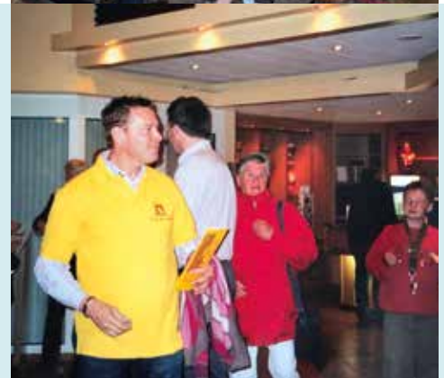
2006 Ambassadeur Albert Verlinde.