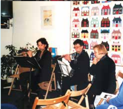
1992 Muziek en zang in het huis.