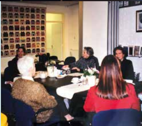
2002 Vergadering met vrijwilligers.