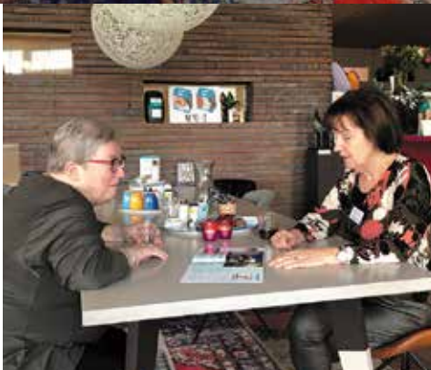
2021 Gastvrouw in gesprek met een gast.

Het was een enorme ervaring, genoten, een uitdaging overwonnen en dat voor én met een hele mooie stichting”.