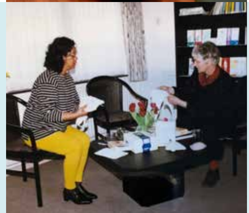
2007 Een gesprek over de breiboezem.