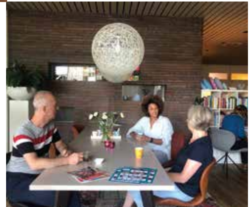
2021 Intern overleg.