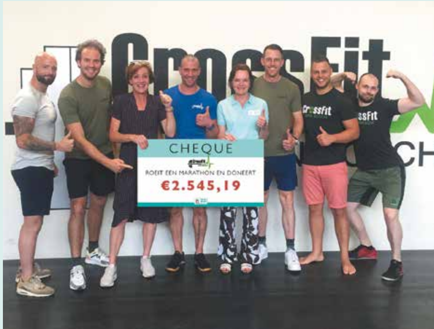
Het team van CrossFit Den Bosch.