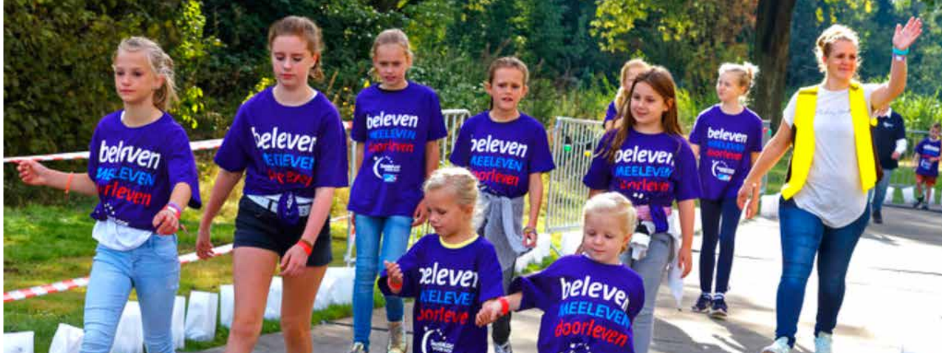
De Samenloop voor Hoop in Esch