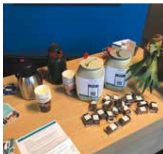
De KoffieBreak bij Drukkerij van Gerwen in februari 2019.